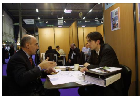
Pendant que je continue mes rendez-vous...

Sur un stand où il y a plusieurs participants, l'organisation fera déjeuner vos collaborateurs séparément. Pendant que l'un de vos collaborateurs déjeune avec un client, l'autre continue les rendez-vous sur le stand.