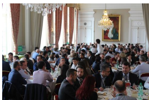
... mon collaborateur déjeune avec des clients potentiels.